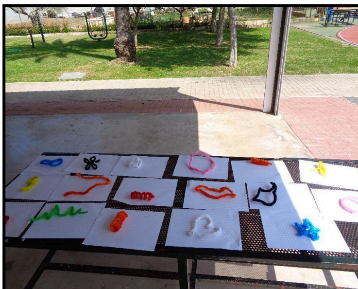
Museo de formas

Se reparte a cada participante un limpiapiipas de diferentes colores, inicialmente sin forma. Se les invita a modelarlo, creando una figura que evoque el nacimiento o la creación. Posteriormente, se organiza una exposición a modo de “museo”, colocando cada creación sobre un folio en blanco dentro de un círculo, permitiendo que todos observen las producciones de sus compañeros.