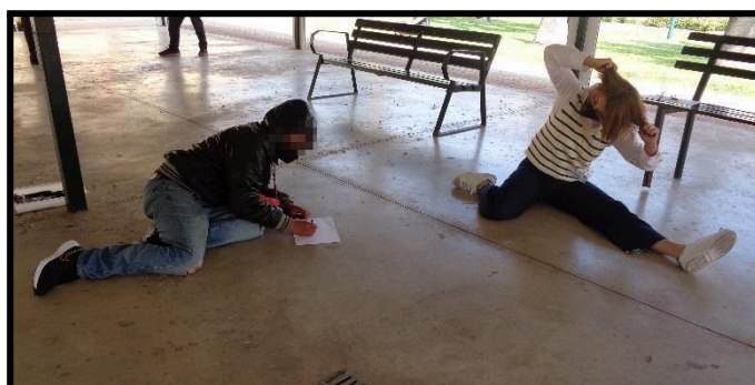
Dibujando la emoción a través del cuerpo en parejas (adolescencia)