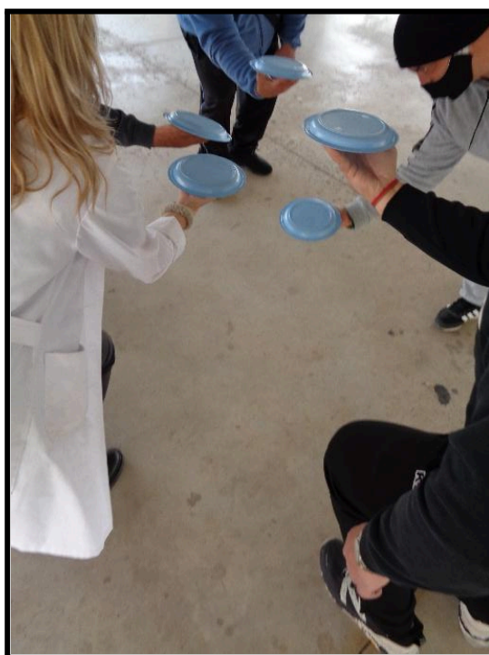
Improvisación grupal con platos (madurez)

Finalmente, se realiza un recorrido desde el nacimiento hasta la juventud con acompañamiento musical; tras ello, cada participante recoge su plato e interpreta la madurez a través del equilibrio y el movimiento.